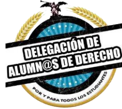
Delegación de la Facultad de Derecho