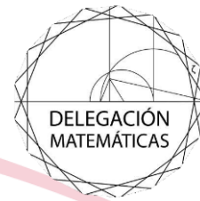
Delegación de la Facultad de Matemáticas