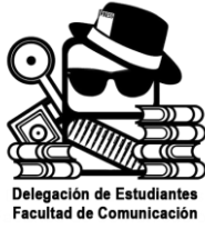
Delegación de la Facultad de Comunicación