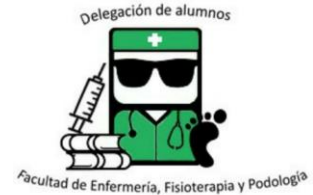
Delegación de la Facultad de Enfermería, Fisioterapia y Podología