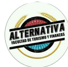
Delegación de la Facultad de Turismo y Finanzas