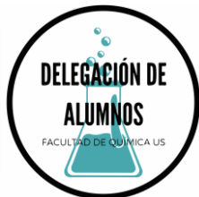
Delegación de la Facultad de Química