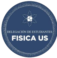
Delegación de la Facultad de Física